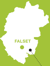
La Torre de Fontaubella

Nivel: Ruta exigente, para buenos caminadores